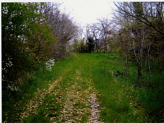
A mi-chemin, sur l'emprise du futur Parc de Vidailhan