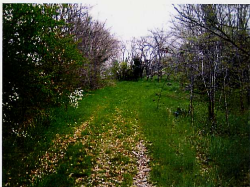
Près du rond point du CEAT