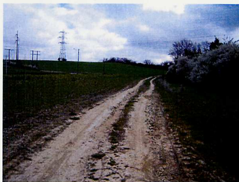
L'entrée du chemin, avenue Georges Pompidou ; quelques mètres seulement sont carrossables.